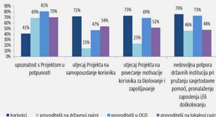
Uočene razlike u percepciji provedbe Projekta