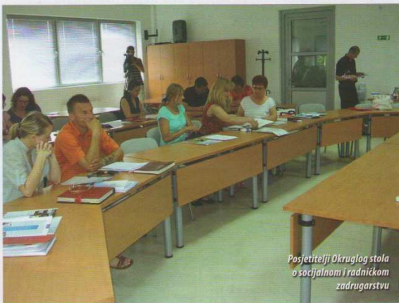
Posjetitelji Okruglog stola o socijalnom i radničkom zadugarstvu

Sredinom lipnja je u prostorijama Poduzetničkog inkubatora BIOS u organizaciji Hrvatskog saveza zadruga i osječkog Centra za poduzetništvo održan je Okrugli stol o socijalnom i radničkom zadugarstvu. Bila je to izvanredna prilika za