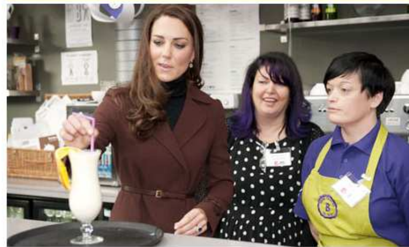
Kate tries out a 'duchess' smoothie at the dry bar

Kate Middleton visited the Brink dry bar in Liverpool this week, where she tasted the Duchess, a smoothie created in her honour (banana, honey, almonds, milk and a dash of cream). But what's the difference between a